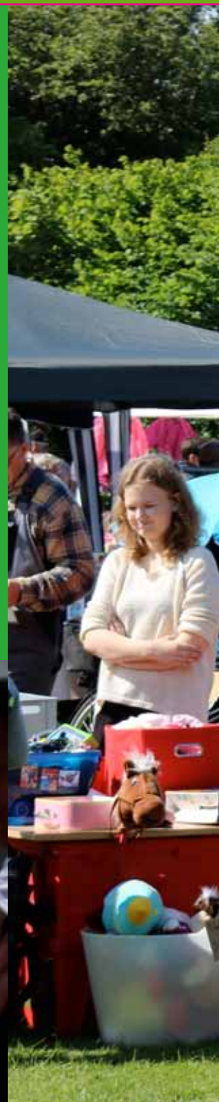
Billederne på omslaget er fra loppemarkedet i Hjarup.

Deadlines i 2015: 20. august – 22. oktober – 10. december