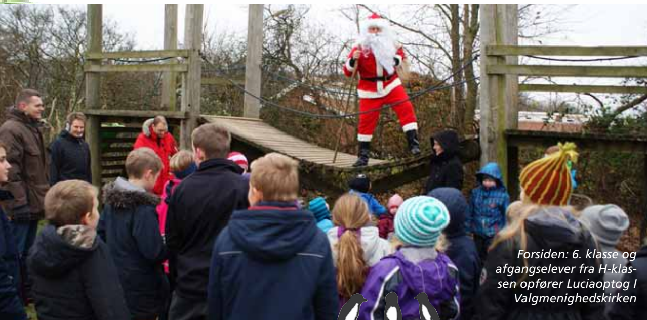
Forsiden: 6. klasse og afgangselever fra H-klas- sen opfører Luciaoptog i Valgmenighedskirken