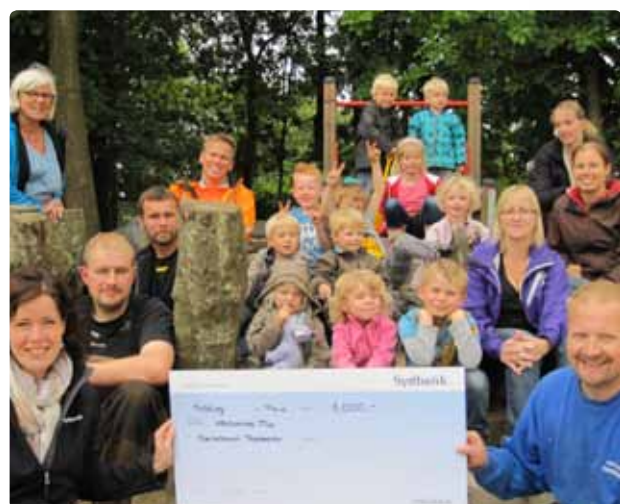
◀ Check på 8.000 kr. fra Sydbank-Fonden

Fredag den 22. juni tager 3. klasse en hel dag til Gram Slot, hvor de bl.a. skal se slottet og lave mad over bål. Klassen skal tage afsked med deres klasselærer og matematiklærer, da de efter ferien skal have helt nye lærer. :)