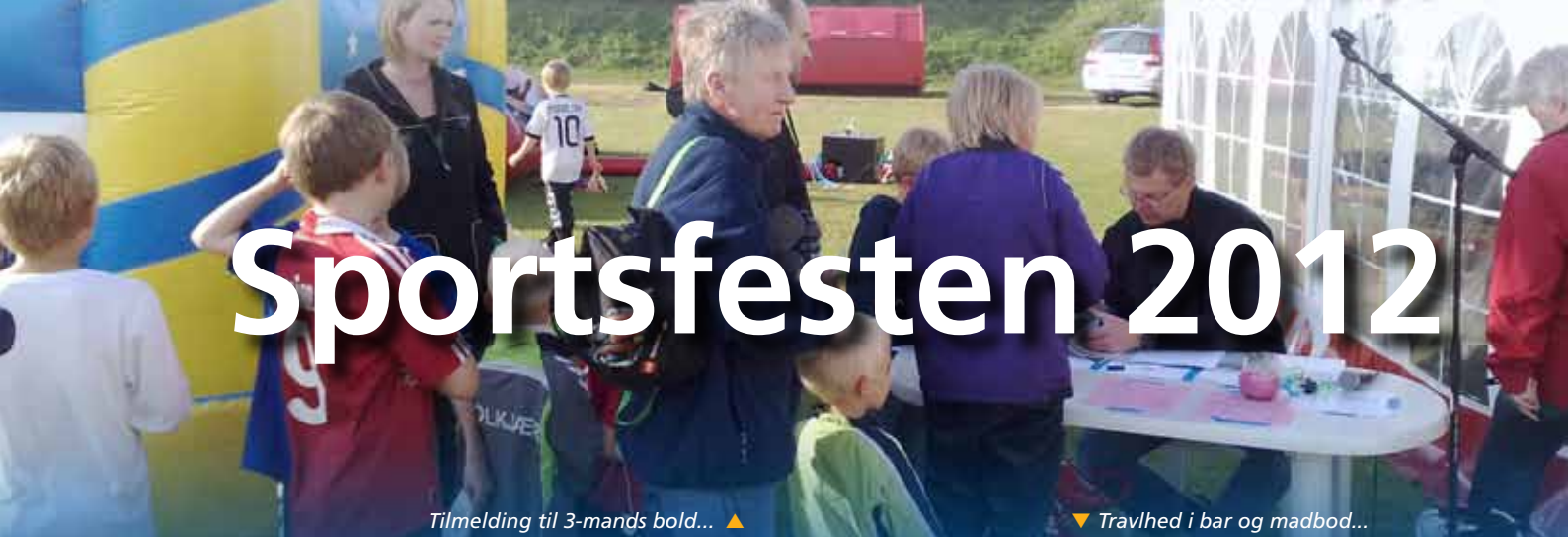
▲ Tilmelding til 3-mands bold...