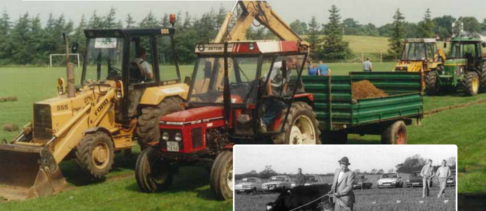
▼ Dræning af sportspladsen på Forbundsskolen. Et samarbejde mellem Idrætsforeningen og skolen...