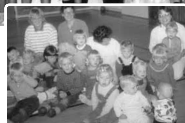
▲ Børnegruppen 1987/88. En forløber for Trekløveren...