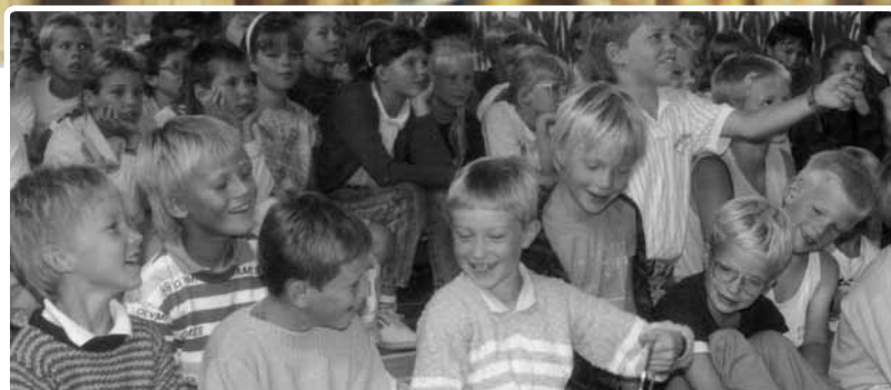
▲ Festligt arrangement på Forbundsskolen...