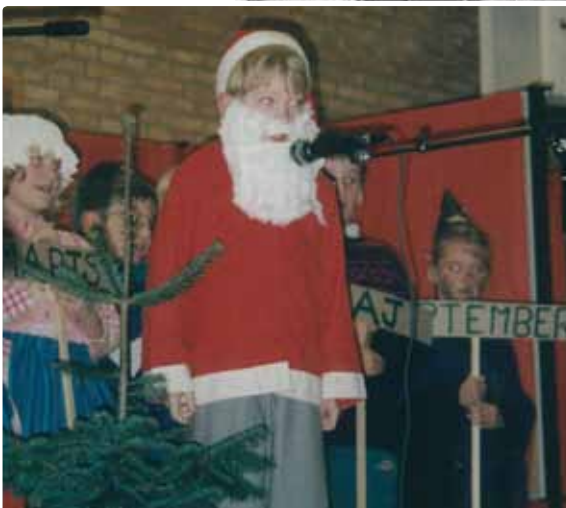
▲ Julearrangement på skolen...