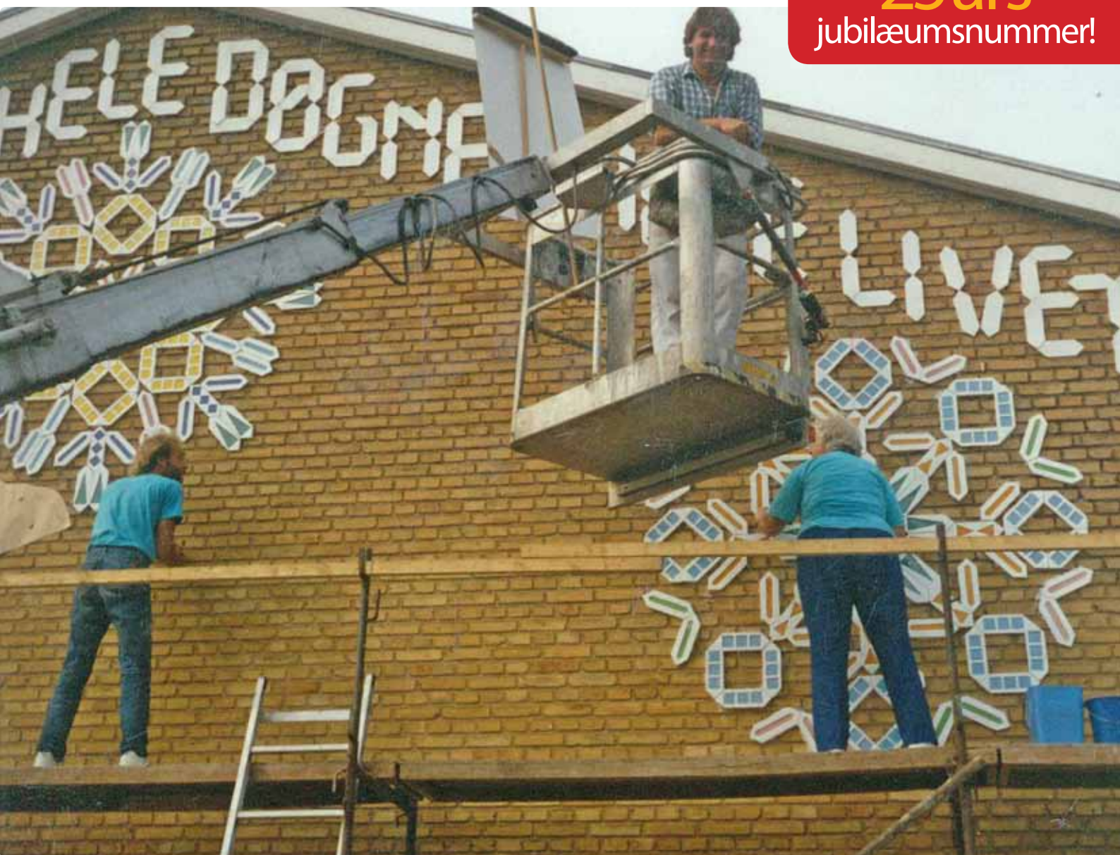
▲ Udsmykning af Forbundsskolen var et fælles projekt for hele området og en del af udviklingsarbejdet.