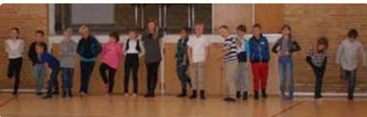
▲ Eleverne er klar til at "banke" forældre i boldspil...

I emneugen skulle 3. klasse forberede en mexikansk klassefest for deres forældre, så torsdag aften var børn og forældre til klassefest/afslutning i 3. klasse. Børnene havde pyntet fint i aulaen og forberedt en lille sportsturnering, men pga. det dejlige regnvejr, blev det til en gang bold i gymnastiksalen i stedet for.