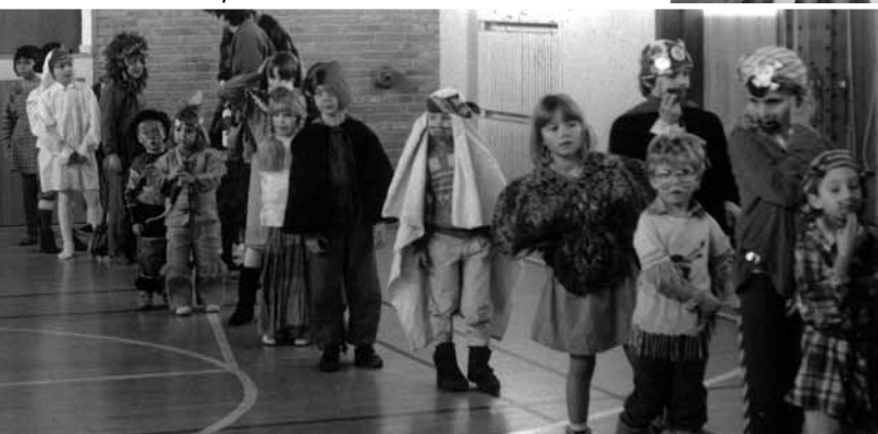
▲ Budstikken til skolefest...