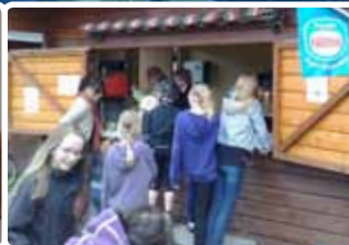
▲ Sliksultne unge...