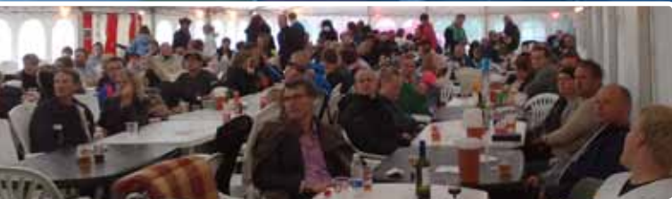
▲ Hygge med fodbold på storskærm i teltet...