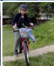
▲ Fuld kontrol...