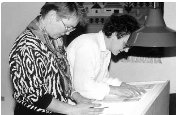
▲ Dyb koncentration, teksten skal sidde lige!

Bladets format var A5 størrelse. Nogle eksemplarer blev lavet i A4 størrelse af hensyn til svagtseende læsere. Efter nogen tid overgik vi faktisk til A4 størrelse til alle modtagere, da det var meget mere læsevenligt. Det var dog også noget dyrere at sende ud til modtagere, så det krævede nogle overvejelser inden den beslutning blev taget.