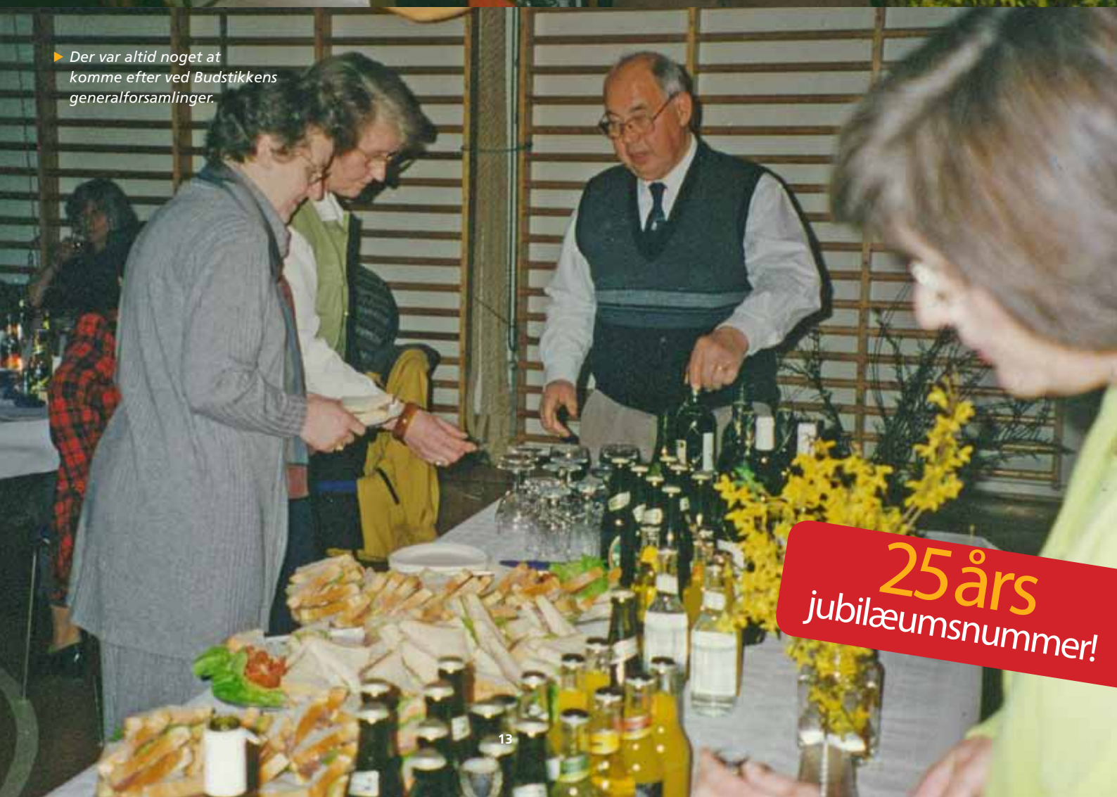
► Der var altid noget at komme efter ved Budstikkens generalforsamlinger.