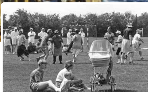
▲ Sportsfest på Forbundsskolen...